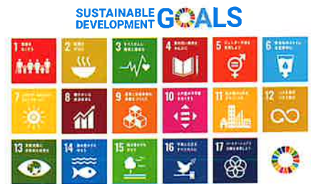
持続可能な社会の実現に向けて

★登録基準があります。 詳細は HP でご確認ください【新居浜市>組織で探す>産業振興課>企業のSDGsの達成に向けた取組を応援します】