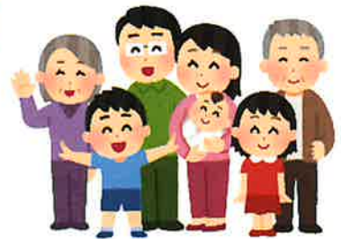
誰もが働きやすく、活躍できる職場へ

★認定基準があります。 詳細は HP でご確認ください【新居浜市>組織で探す>産業振興課>企業の働き方改革の取組を応援します】